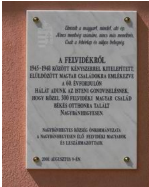
1. ábra Nagybánhegyes Polgármesterihivatal emléktábla

Edvard Beneš köztársasági elnök nevéhez fűződik a Beneš dekrétum, melynek célja a „Tiszta szláv nemzetállam” megteremtése, és a magyar kisebbség felszámolása.